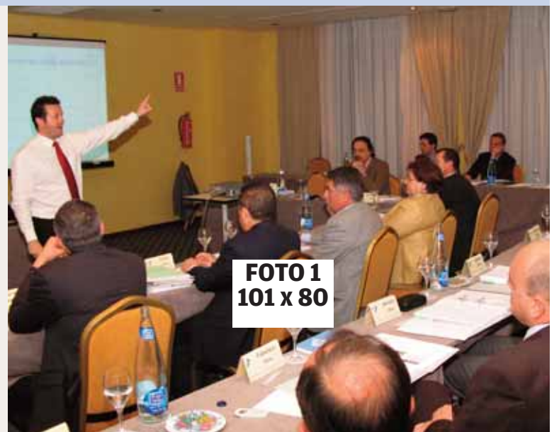
Última edición del Senior Management Program

El programa tiene una duración de 80 horas, que se desarrollan a lo largo de 14 sesiones lectivas de formación. Las reuniones de trabajo se celebran los martes, con un horario que permite compaginar la asistencia con el desempeño de sus responsabilidades. Algunas semanas, la sesión es una jornada completa con horario de 9.30 horas a 14.30 horas y de 16.00 a 19.30 horas; en otras, es de media jornada, de 9.30 a 14.30 horas. Ambas incluyen almuerzo de trabajo.