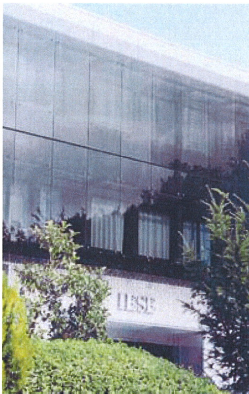
Campus de la IESE Business School en la Universidad de Navarra.

Además del Instituto de Empresa, las otras dos escuelas españolas que sitúan sus MBA entre los