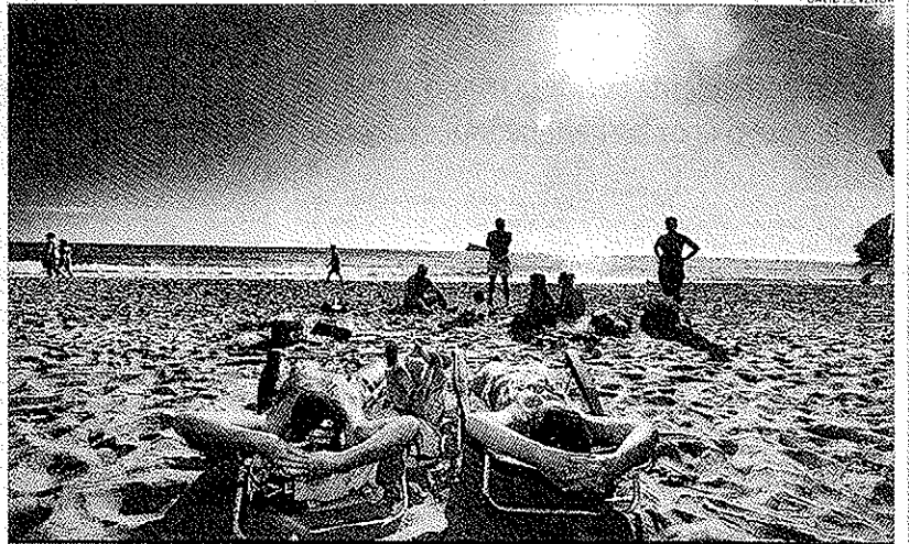
Turistas españoles toman el sol en una playa de Benidorm durante la mañana de ayer.

La estación de trenes de Alicante tampoco tuvo incidencias pese al incremento, estimado, de plazas de un 10 por ciento, respecto a la oferta habitual, lo que significa añadir cerca de 2.100 plazas extra. La predicción meteorológica para hoy es de cielos despejados con temperaturas que rondan los 20 grados en la costa, aunque para mañana se esperan algunas nubes sin riesgo de precipitaciones.