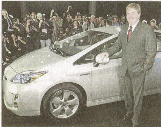
El vicepresidente del grupo Toyota, Bob Carter, posa junto al Prius.

Se estima que estos coches ecológicos de recorrido medio ahorran al año alrededor del 25% de combustible, lo que se traduce en unos 200 litros anuales. Los beneficios obtenidos con la compra de estos vehículos no son sólo económicos ya que con esta adquisición también se contribuye a reducir el consumo de energía y disminuir las emisiones de CO2. Para facilitar la adquisición de estos vehículos, el Programa CO2TXE prevé realizar el descuento en los propios concesionarios, que participarán en esta iniciativa a través de adhesiones. El descuento será aplicado directamente al comprador en el concesionario sin nece-