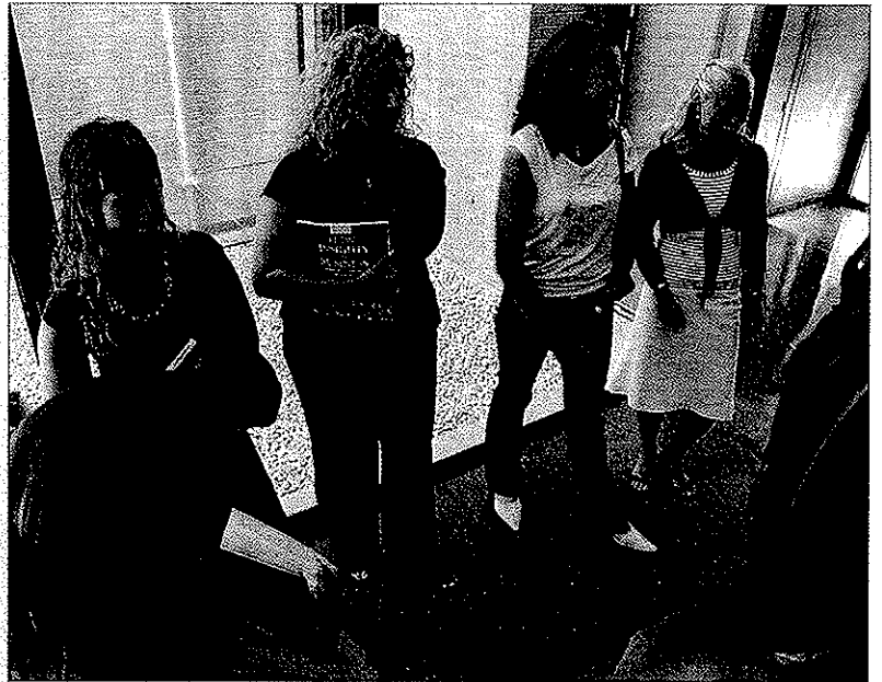
Imagen de estudiantes de Fundesem.

Todos los alumnos que hayan cursado el máster de Fundesem de referencia obtendrán un título de máster adicional al realizar los cursos de especialización. Los nuevos estudiantes inscritos