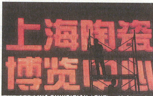
Pocos dudan ya de la utilidad de aprender chino.