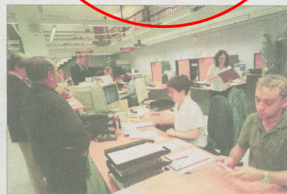
Unos funcionarios trabajan en un ayuntamiento.

Las corporaciones locales tendrán que cambiar el discurso institucional para navegar en la tormenta; además, necesitan comprender en profundidad el panorama actual de crisis para no tomar decisiones erróneas que malgasten los escasos recursos con los que van a contar. Según el análisis del Instituto de Gestión Pública de Fundesem (IGP), la administración local deberá hacerse con nuevas herramientas prácticas de aplicabilidad inmediata para capear el temporal. Los ayuntamientos tendrán compromisos y proyectos sobre los que habrá que decidir si se llevan a cabo o se descartan. Estas y otras estrategias se pondrán encima de la mesa en la conferencia «Gestión estratégica institucional ante la crisis 2008-2010» que tendrá lugar en las instalaciones de Fundesem el próximo jueves a las 18.30 horas y que organiza el IGP. La crisis pondrá a prueba las dotes de los políticos locales en la planificación y gestión estratégica de sus ayuntamientos. El