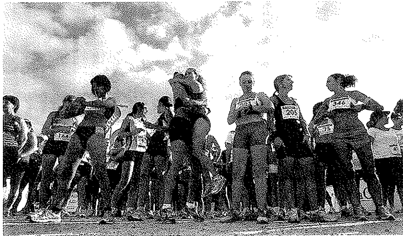
Las participantes en la I Carrera de la Mujer preparadas antes de dar comienzo la prueba.

Los cinco ganadores de cada categoría podrán mejorar su formación gracias a esta iniciativa. Fundesem tiene multitud de cursos y postgrados, desde idiomas hasta máster económicos, financieros, de marketing, de recursos humanos o jurídicos.