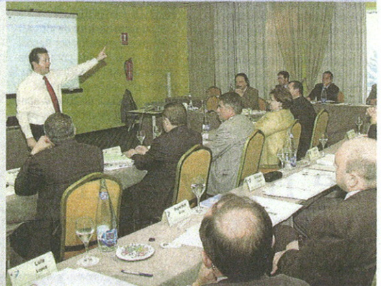
Última edición del Senior Management Program

El programa tiene una duración de 80 horas, que se desarrollan a lo largo de 14 sesiones lectivas de formación. Las reuniones de trabajo se celebran los martes, con un horario que permite compaginar la asistencia con el desempeño de sus responsabilidades. Algunas semanas, la sesión es una jornada completa con horario de 9.30 horas a 14.30 horas y de 16.00 a 19.30 horas; en otras, es de media jornada, de 9.30 a 14.30 horas. Ambas incluyen almuerzo de trabajo.