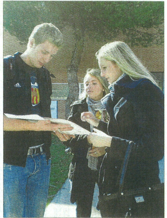
Alumnos de Fundesem.

Desde su lanzamiento en diciembre de 2009, las diez ediciones de Fundesem Alumni Update han sido seguidas por más de 100.000 lectores que reciben di-