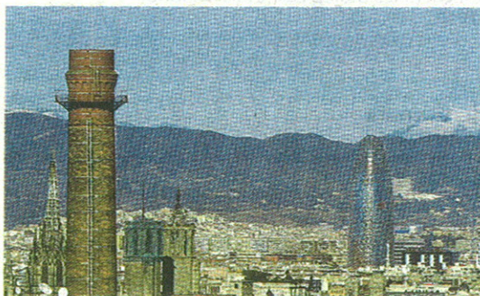
Vista de una parte de Barcelona desde la montaña de Montjuïc.